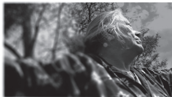
La Bonne - Sala gran C/ Sant Pere més baix, 7 Sessió gratuïta

Amb la col·laboració de La Bonne, Centre de Cultura de Dones Francesca Bonnemaison