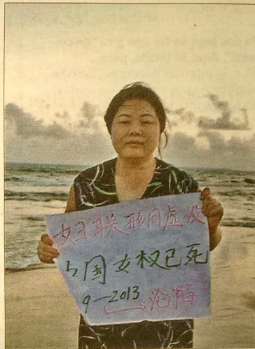
'Un'ora sola ti vorrei' i 'Hooligan sparrow', dos dels films dirigits per dones de la mostra d'aquest any

ntes, es ció". És que ha que re- directo-