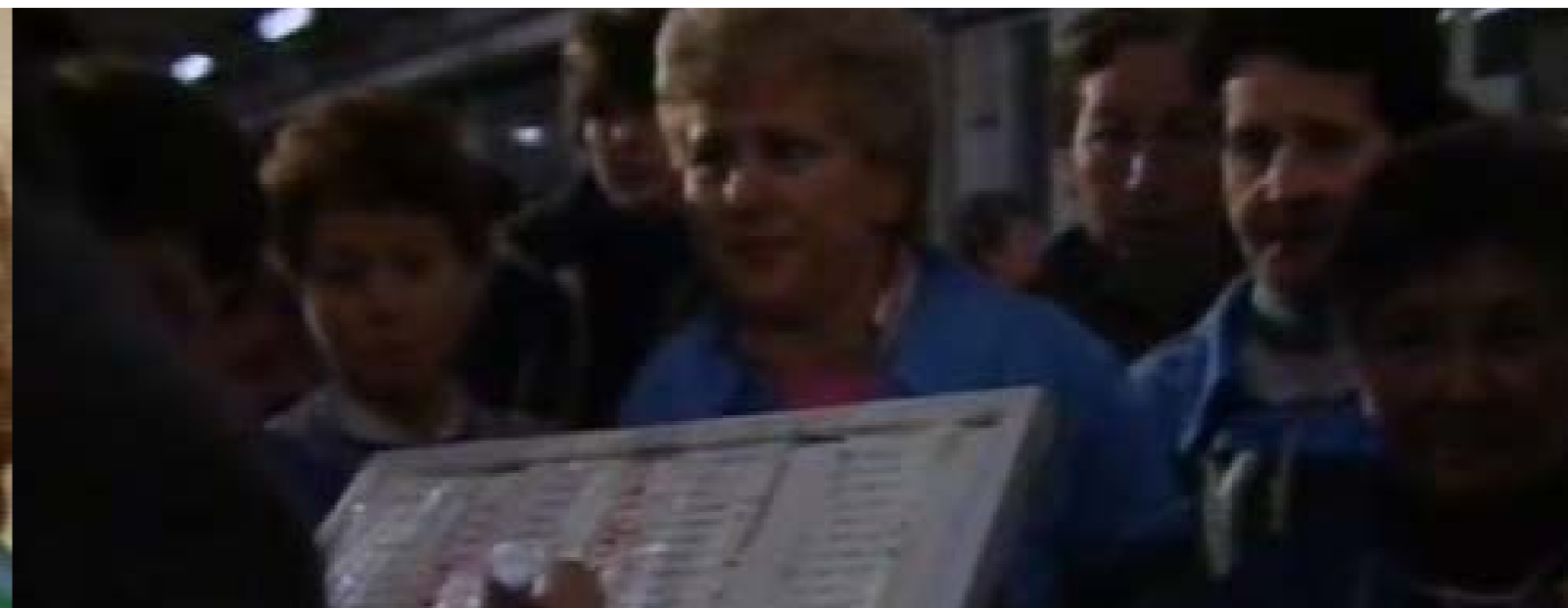
Les travailleuses de la mer (Las trabajadoras del mar), Carole Roussopoulos França, 1985, 25 minuts. DVD.

La Claudine, la Monique, l'Emmanuelle i l'Anne, que s'han conegut gràcies al servei telefònic d'atenció a les víctimes, donen testimoni dels incestos patits durant la seva infantesa. Recorden el seu malestar i les seves temptatives d'aturar els abusos del seu pare o avi. Evoquen els signes i les paraules amb l'esperança de trobar ajuda en l'entorn.