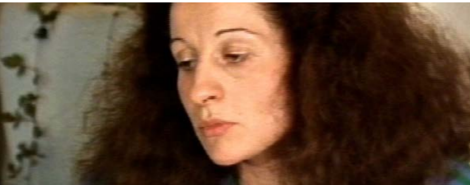
L'inceste, la conspiration des oreilles bouchées, Carole Roussopoulos França, 1988, 30 minuts. VOSC. DVD.

El 1982, les dones dels agricultors estan oficialment « sense professió ». Quatre agricultores de Champagne- Ardennesens parlen del seu amor per l'ofici malgrat les condicions precàries i el repartiment de les tasques amb els seus marits. Uneixen les seves forces i creen la nova Association Féminine pour le Développement de l'Agriculture/ Associació Femenina pel Desenvolupament de l'Agricultura (A.F.D.A.).