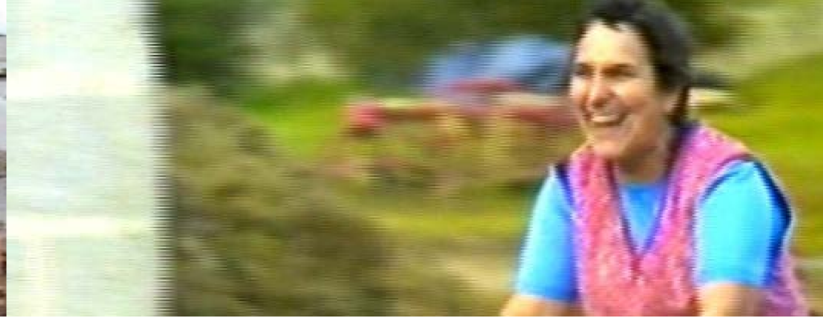
Profession: agricultrice (Profesión: agricultora), Carole Roussopoulos França, 1982, 40 minuts. VOSC. DVD.

Sis dones dedicades al cultiu de mol·luscs a la conca de Marennes-Oléron (Charente-Maritime) deixen testimoni de les seves condicions de vida i de treball, de les dificultats de la professió i del repartiment de les tasques entre homes i dones.